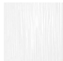
エスプリ ホワイト T1401