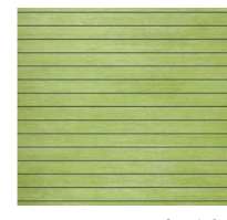
スタイル モザイクグリーン T1876