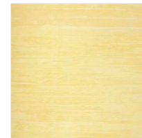
スタイル オレンジ T1841